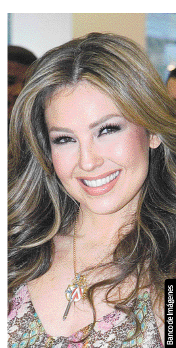
Thalía celebra el primer aniversario de su programa de radio.

Ante las versiones de la separación de Luis Miguel con Aracely Arámbula comentó: “Nada más poner una balanza de tu vida lo que te hace más feliz y seguir ese camino”.