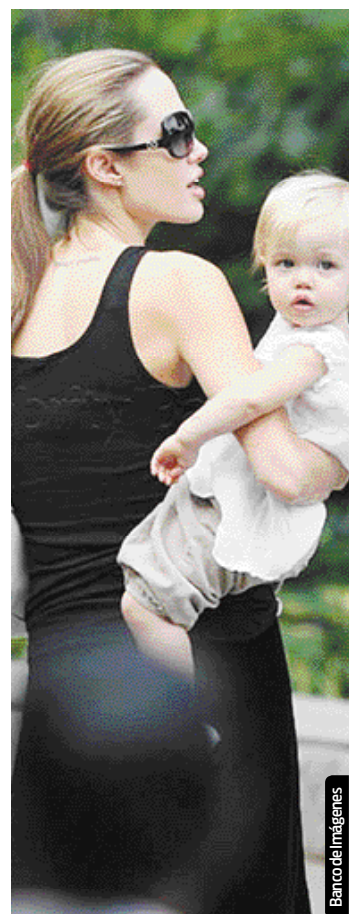
La popularidad de Shiloh podría disminuir tras el nacimiento de sus hermanos.